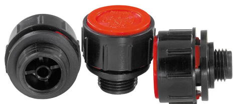
Princípio de funcionamento

Descrição do artigo/Imagens dos produtos